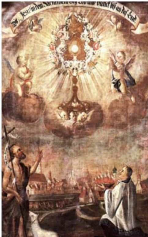
Nur die Heiligen konnten noch helfen

In den Morgenstunden erstürmten 200 österreichische Dragoner das Münchner Tor an der heutigen Weillhammer Klamm. Die französischen Grenadiere verschanzten sich am Friedhof bei der Kirche mit „2 geladenen Kanonenteilen“. Der Häuserkampf verlief sehr heftig und dauerte zwischen 1/2 und 3/4 Stunde, bis die Franzosen übers Scheyerer Tor abzogen. Die siegreichen Reiter plünderten „in erster Hitz“ die Stadt, wurden aber schnell wieder zur Ordnung gerufen. Darauf besetzten die „Banalisten“, also Kroaten, die auch Panduren genannt wurden, die Stadt. Wie es scheint kam es durch sie zu einer zweiten Plünderung.