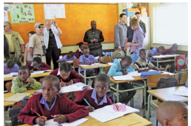
Aufmerksame Kinder: Beim Besuch der „Diaz-Schule“ in Lüderitz