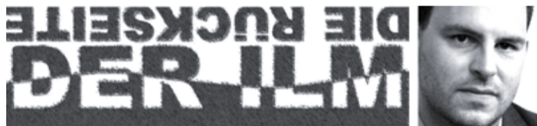
von Roland Scheerer

Menschen flanieren über den Sparkassenplatz in der Frühlingssonne. Die meisten dieser Menschen sind beschriftet. Beschriftet mit Texten. Viele auch mit Nummern. Viele auch mit beidem, mit Nummern und Texten.