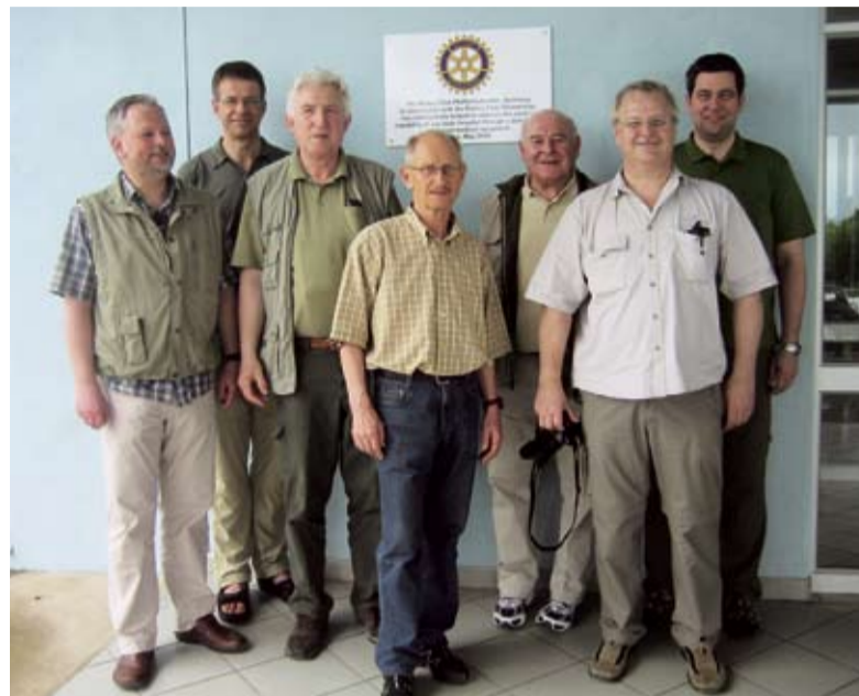
Die Rotarier vor „ihrem“ Krankenhaus in der namibischen Stadt Outjo

Von einer Unzahl bedeutsamer Eindrücke mögen hier nur einige wenige skizziert werden: Der Besuch des Grundversorgungskrankenhauses in der etwa 6000 Einwohner zählenden Kreisstadt Outjo bestätigte in vollem Maße die Notwendigkeit des Gemein-